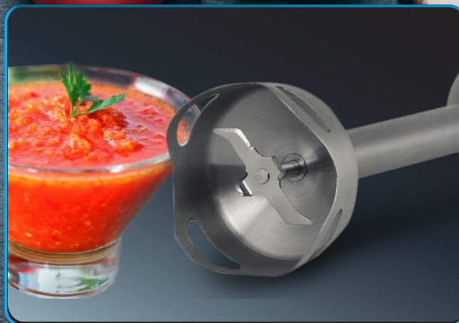
Насадка-блендер «Easy Blend» из нержавеющей стали

Погружной блендер ВН-345 М представляет собой компактный и функциональный кухонный прибор, который станет вашим незаменимым помощником на кухне.