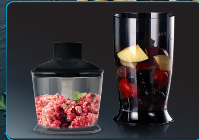
Чаша для измельчения и стакан для смешивания